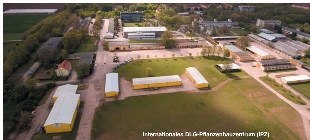
Internationales DLG-Pflanzenbauzentrum (IPZ)

Die beiden DLG-Fachzentren Landwirtschaft und Lebensmittel sind mit ihren Kongressen, Tagungen und Foren wichtige Plattformen für den fachlichen Dialog und Fortschritt. Ergänzt wird dieses Angebot durch zahlreiche Publikationen wie die DLG-Merkblätter, die DLG-Expertenwissen und internationale Trendanalysen. Die DLG-Akademie eröffnet ihren Absolventen die Chance, Schlüsselqualifikationen für die Zukunft zu erwerben, vom praktischen Know-how bis zur strategischen Unternehmensplanung. Mit all dem zielt das Wissensmanagement der DLG schon heute auf Lösungen für die Märkte von morgen.