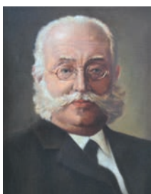
DLG-Gründer Max Eyth